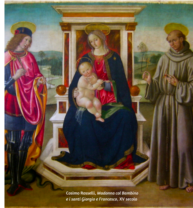
Cosimo Rosselli, Madonna col Bambino e i santi Giorgio e Francesco , XV secolo