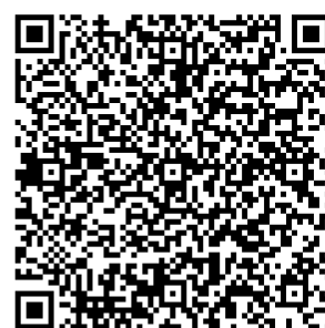
Art Bonus Regionale