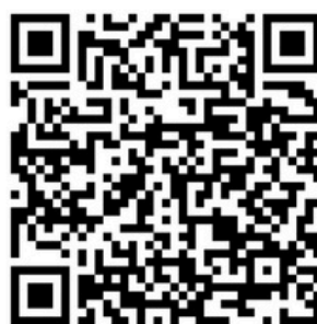
Art Bonus Nazionale