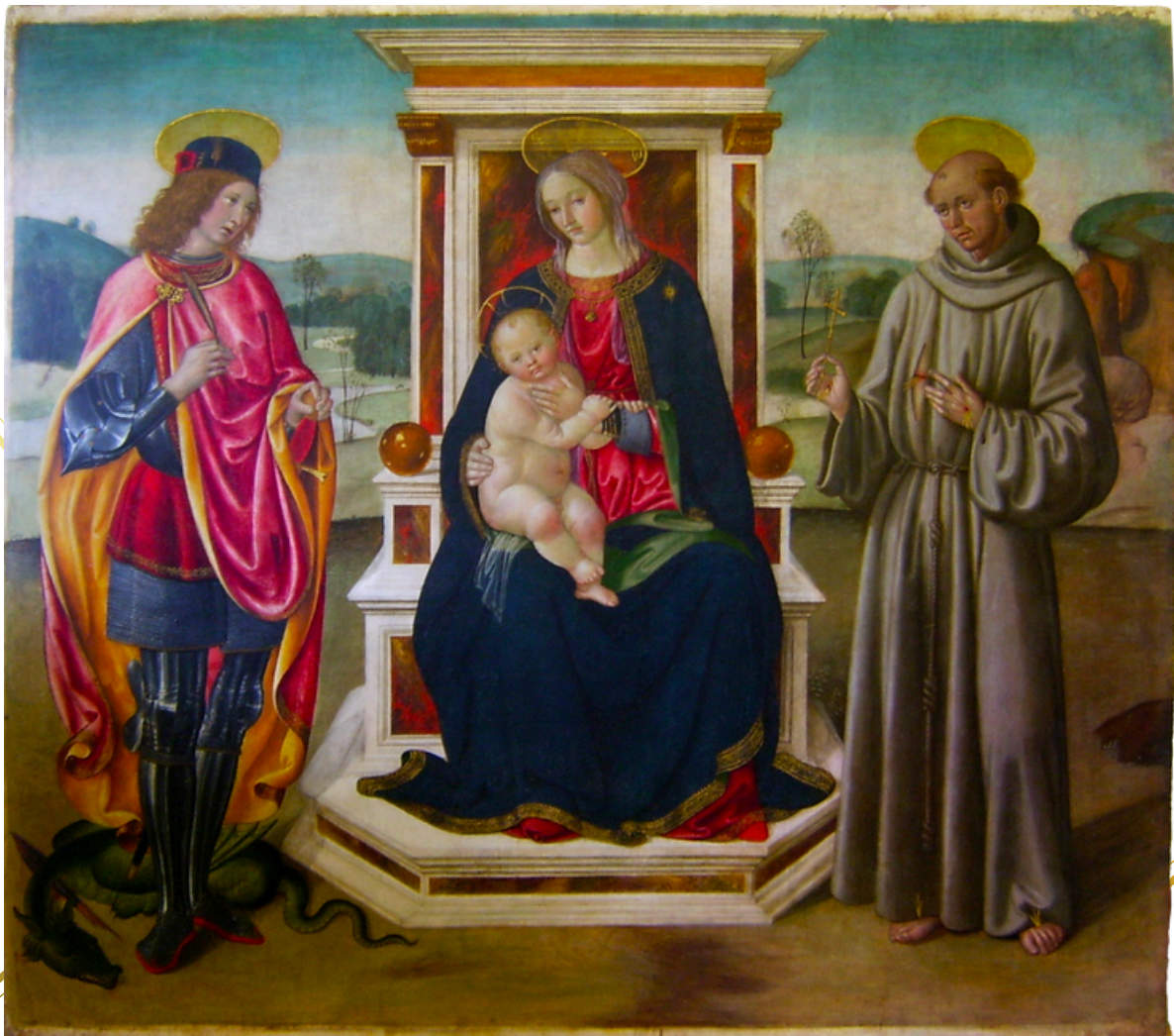
Cosimo Rosselli, Madonna col Bambino e i santi Giorgio e Francesco , XV secolo

Contribuisci a tutelare e valorizzare il patrimonio culturale e ambientale italiano. Diventa un mecenate sostenendo il Museo Archeologico del Chianti per la mostra!